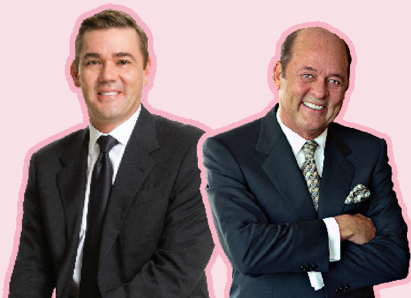
Раян Роджерс Президент та Головний виконавчий директор